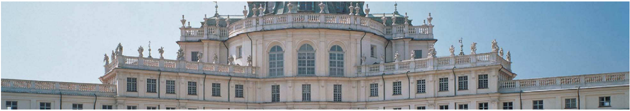
Torino - Residenza di caccia di Stupinigi

Prima colazione in albergo, trasferimento in auto privata o minivan alla Residenza di Caccia di Stupinigi e poi a quella del Castello di Racconigi. Visita al Castello e pranzo in un ristorante tipico della zona con assaggi delle eccellenze del territorio. Ritorno al castello e visita del giardino in carrozza. Nel pomeriggio trasferimento in auto privata o minivan a Torino. Aperitivo in un caffè storico del centro. Ritorno in albergo e cena in un ottimo ristorante cittadino.