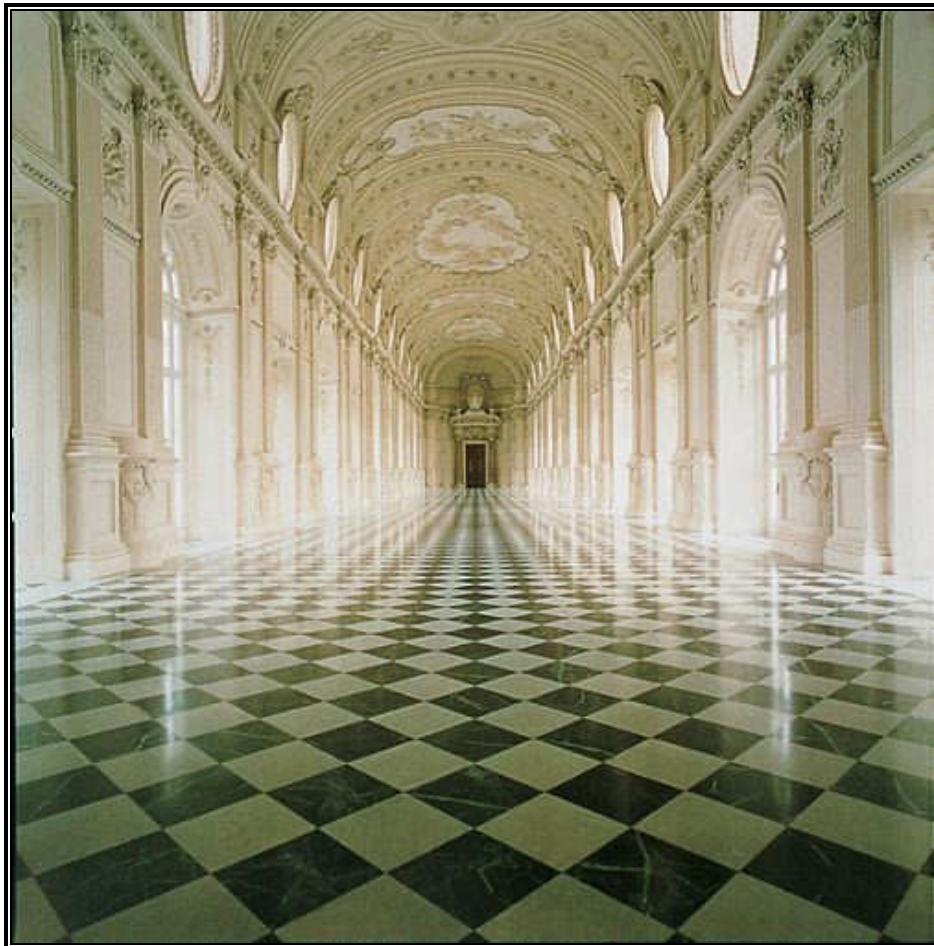
Torino - Reggia di Venaria, Salone di Diana