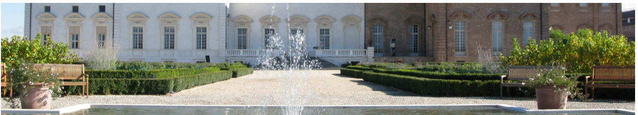
Torino- Reggia di Venaria

Prima colazione in albergo, ritrovo con la guida di Cube nella hall dell'albergo e passeggiata fino a Palazzo Madama per la visita, accompagnati da una guida privata. Al termine trasferimento al Museo del Cinema. Pranzo leggero nel ristorante all'interno della Mole e, al termine, visita con guida privata del Museo e salita sulla Mole. Trasferimento a Venaria in auto privata o minivan. Visita alla residenza sabauda e ai suoi giardini. Rientro a Torino per la cena. Pernottamento.