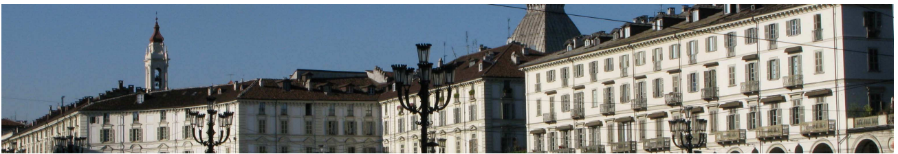
Torino - Piazza Vittorio

Arrivo degli ospiti in mattinata e trasferimento con auto o minivan privati dall' aeroporto di Caselle a Torino. Sistemazione nell'albergo prescelto. Riunione con la guida di Cube nella hall dell'albergo e inizio della visita nel centro storico, accompagnati da una guida privata, per apprezzare le vie, le piazze e i monumenti della città: la Chiesa di San Lorenzo, il uomo, i resti romani del Teatro e la Porta Palatine, Piazza Palazzo di Città, Via Palazzo di Città, Chiesa del Corpus Domini, Via Garibaldi, Via Roma, Piazza san Carlo, Via Maria Vittoria, Via Accademia delle Scienze, Piazza Carignano, Piazza Carlo Alberto. Ritorno in albergo e cena in un famoso ristorante stellato Michelin del centro città.