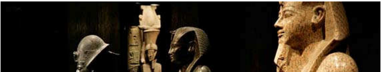
Torino - Museo Egizio

Prima colazione in albergo, trasferimento in auto private o minivan ad Agliè per la visita al Castello, in estate è possibile visitare I suoi magnifici giardini. Pranzo ad Agliè e ritorno a Torino giusto in tempo per visitare il Museo Egizio, accompagnati da una guida. Ritorno in albergo. Cena in un famoso ristorante in centro città.